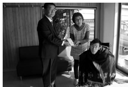
12月2日／デンソー安城寄付金贈呈