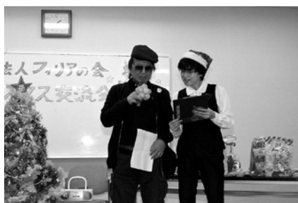
12月12日／クリスマス交流会