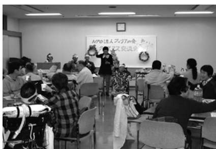
12月12日／クリスマス交流会