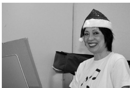
12月12日／クリスマス交流会