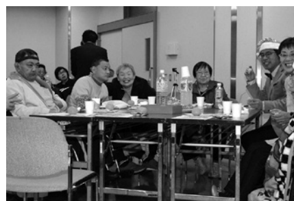
12月12日／クリスマス交流会