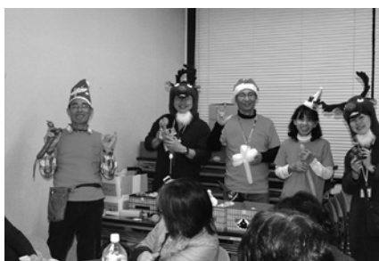
12月12日／クリスマス交流会