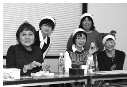
12月12日／クリスマス交流会