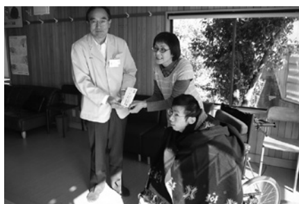
12月2日／デンソー安城寄付金贈呈