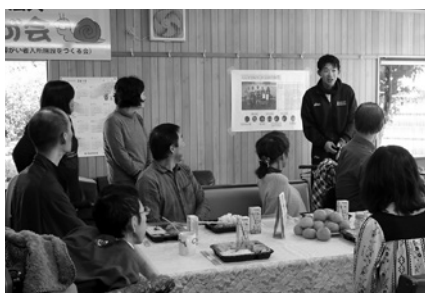
11月28日／デンソーチームゴツムリ昼食会